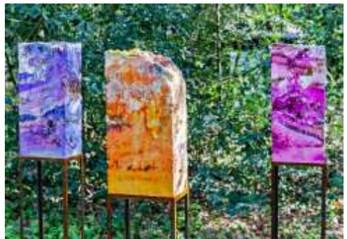
Zwemmen en vliegen, de vijfde dag

De buitententoonstelling wordt omlijst door een publieksprogramma vol aantrekkelijke activiteiten. Zoals interessante lezingen, buitenconcerten met klassieke en lichte muziek (zondag), begeleide wandelingen, workshops schrijf, groen en natuurfotografie.