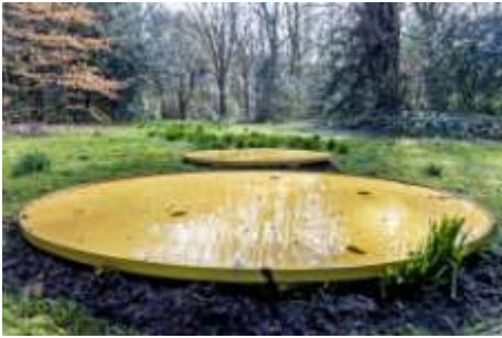
Water, de tweede dag

Een unieke buitententoonstelling. Tussen de kapellen en het groen staan kunstwerken opgesteld, geïnspireerd op de zeven dagen uit het scheppingsverhaal (Genesis 1). De zeven kunstwerken zijn speciaal voor deze tentoonstelling gemaakt en nog niet eerder vertoond. Via een QR code en bij het Oesdom is een brochure verkrijgbaar met een mediatieve wandeling langs de kunstwerken. Teksten en kleine oefeningen geven verdieping aan de tentoonstelling en zetten aan tot bezinning en verwondering over de schepping en de natuur.