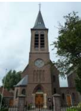
St Jozefkerk in Heeg Friesland

Het bijzondere aan dit gebeuren is dat iedereen, wat voor taal men ook sprak, iedereen kon het verstaan. Met andere woorden de Boodschap die Jezus verkondigde, en heeft voorgeleefd, is bestemd voor iedereen. Daar zijn geen uitzonderingen op.